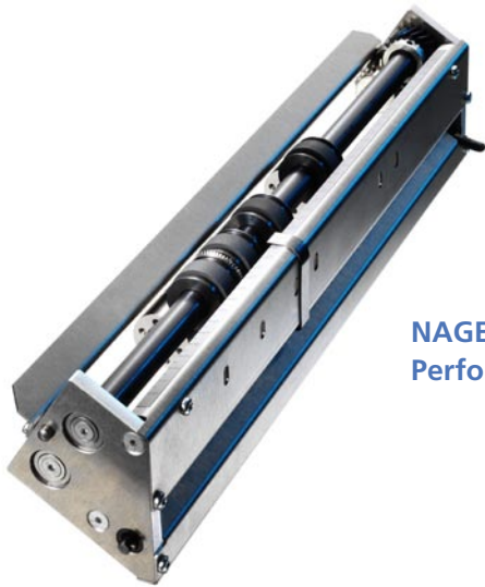
NAGEL DOCUFOLD Perforiereinsatz.