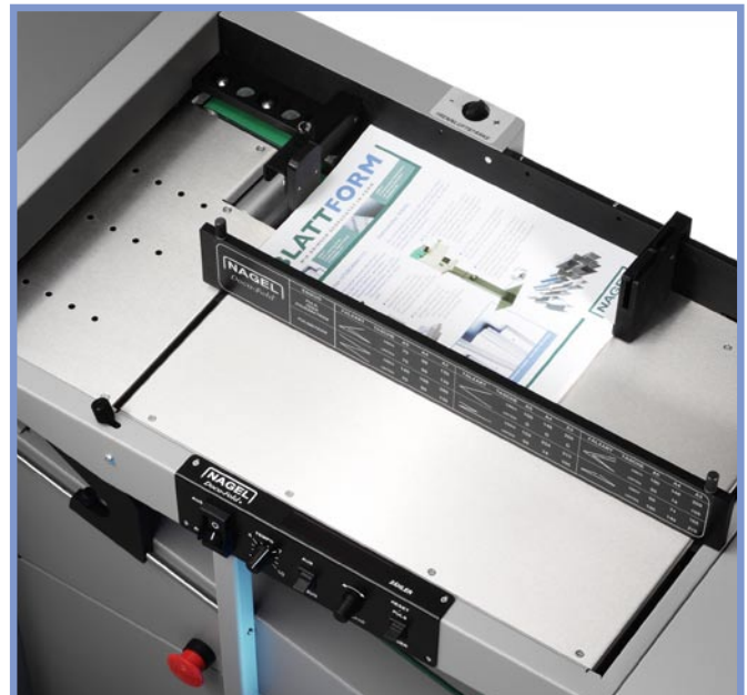
Der Anlagetisch ist übersichtlich und einfach in der Handhabung.

■ Auch die Falzwalzen bedürfen keinerlei Justierung, da sie sich automatisch auf die Papierstärke einstellen – dieses Prinzip spart Zeit und eliminiert Fehlerquellen. Die Digitalanzeige arbeitet auf 0,1 mm genau und lässt sich mühelos programmieren.