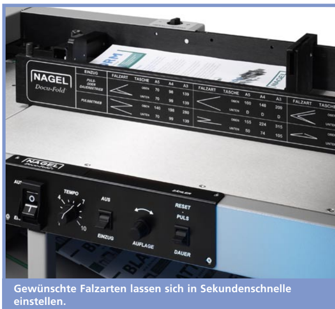
Gewünschte Falzarten lassen sich in Sekundenschnelle einstellen.