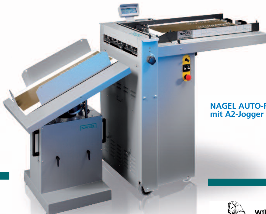
NAGEL AUTO-RILLNAK 50 mit A2-Jogger

■ Der Auto-Rillnak 50 ist größer als der bekannte und bewährte Auto-Rillnak 33 und verarbeitet ohne Mühe Papierformate bis 500 mm Einlaufbreite und bis zu 1.000 mm Länge. Die Papierzuführung erfolgt durch ein Blas- und Saugluftsystem, welches ein Zerkratzen der Digitaldrucke verhindert. Bis zu neun Programme sind speicherbar. Über einen Joystick und ein übersichtliches Display lässt sich der Auto-Rillnak 50 einfach und schnell bedienen.