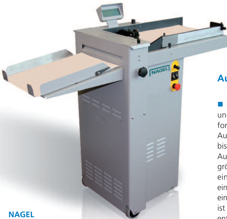
NAGEL AUTO-RILLNAK 33