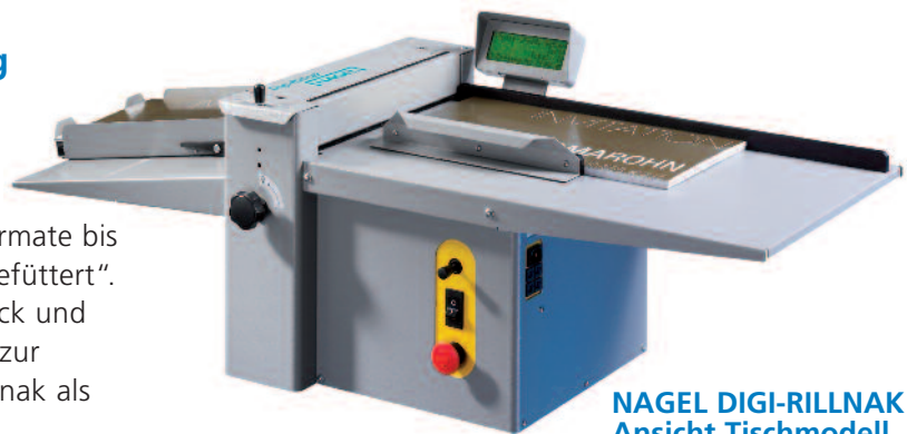
NAGEL DIGI-RILLNAK – Ansicht Tischmodell

■ Der Digi-Rillnak schließt die Lücke zwischen den halb- und vollautomatischen Systemen. Die kompakte Rillmaschine rillt automatisch Formate bis 630 mm x 330 mm, wird jedoch von Hand „gefüttert“. Die Bedienung erfolgt komfortabel über Joystick und Display, ebenso gehört das Perforierwerkzeug zur Standardausstattung. Erhältlich ist der Digi-Rillnak als Tischmodell oder optional mit Ständer.