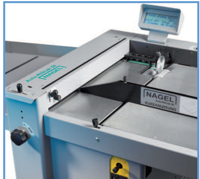
Der Auto-Rillnak 50 ist einfach und schnell bedienbar.

■ Der Auto-Rillnak 50 ist größer als der bekannte und bewährte Auto-Rillnak 33 und verarbeitet ohne Mühe Papierformate bis 500 mm Einlaufbreite und bis zu 1.000 mm Länge. Die Papierzuführung erfolgt durch ein Blas- und Saugluftsystem, welches ein Zerkratzen der Digitaldrucke verhindert. Bis zu neun Programme sind speicherbar. Über einen Joystick und ein übersichtliches Display lässt sich der Auto-Rillnak 50 einfach und schnell bedienen.